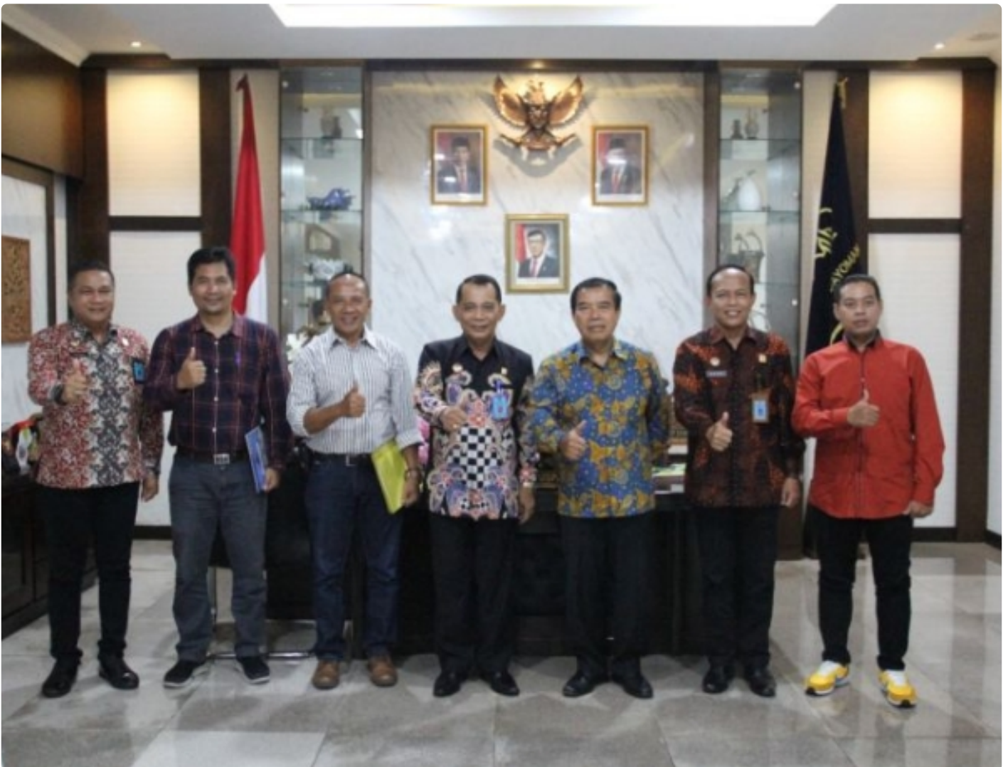
Kemenkumham Jateng - Unimus Jajaki Kerja Sama Bagi Perguruan Tinggi Muhammadiyah dan Aisyiyah

SEMARANG - Sinergitas dan kolaborasi antara Kantor Wilayah Kementerian Hukum dan HAM Jawa Tengah dengan Universitas Muhammadiyah Semarang (Unimus) semakin ditingkatkan.